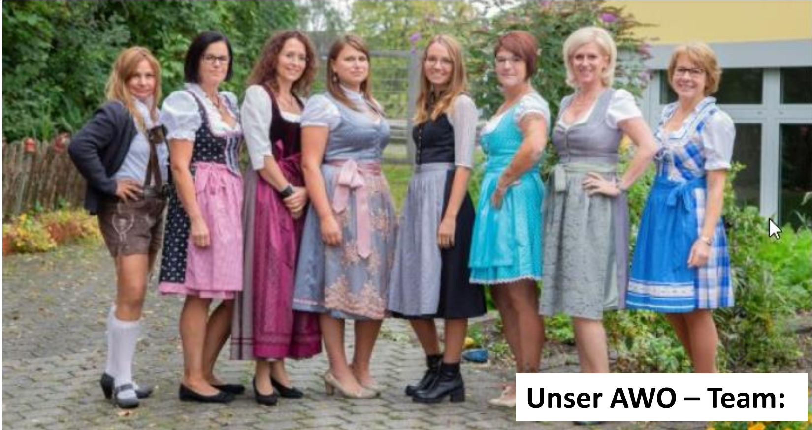
Unser AWO – Team: