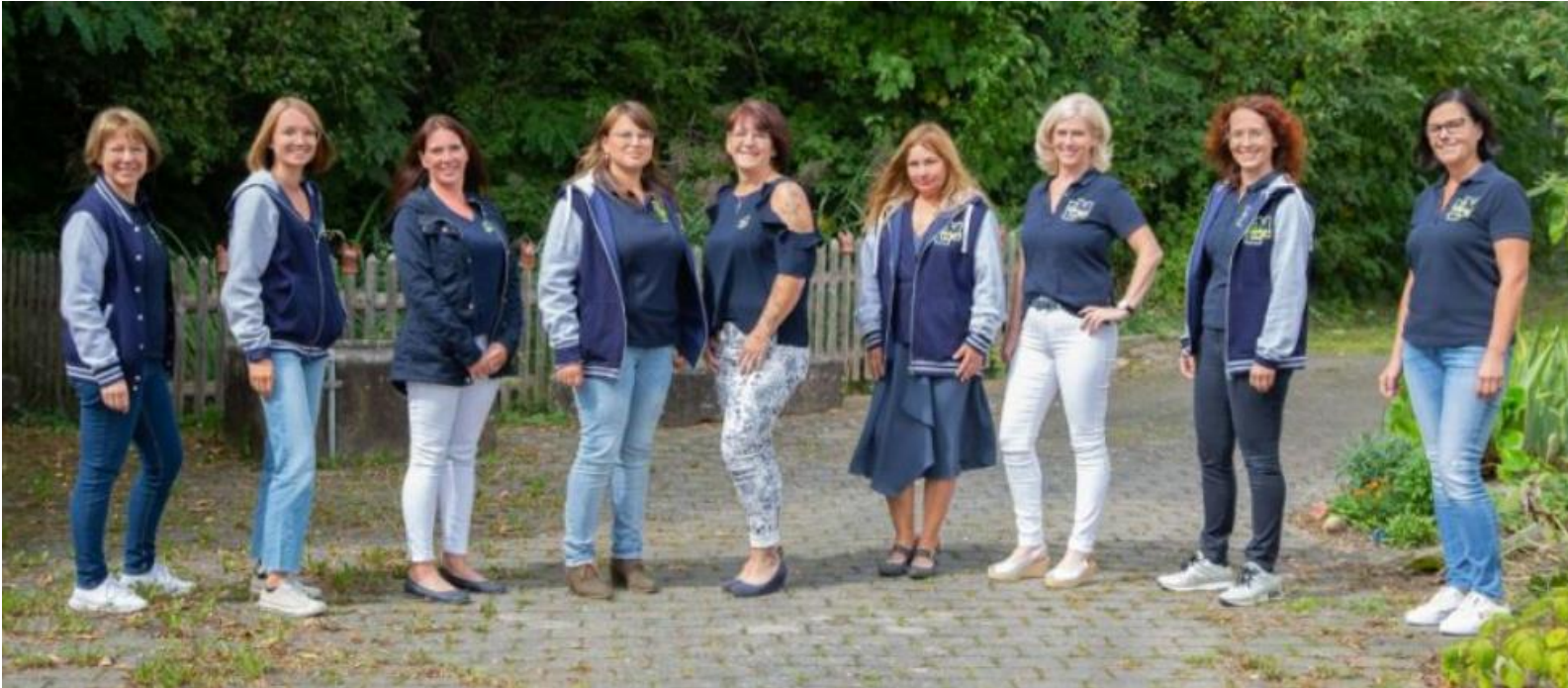
Unser AWO – Team: